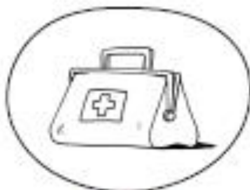
IR AO MÉDICO

Marque a cena que representa exatamente o que Eliseu pediu para Naamã fazer para ser curado de sua lepra.