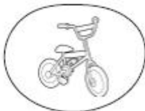
ANDAR DE BICICLETA