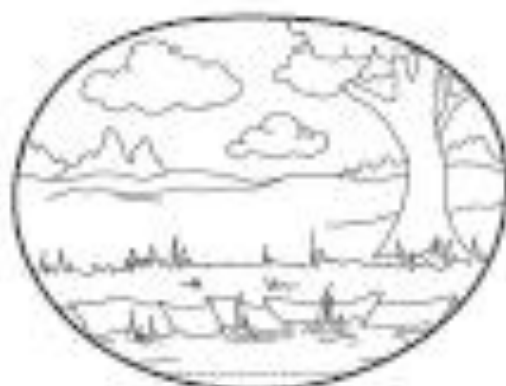
MERGULHAR 7 VEZES NO RIO JORDÃO